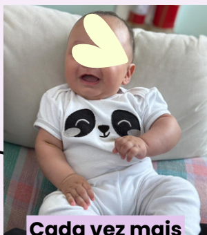
Cada vez mais brincalhão e cativante. Foto aos 8 meses