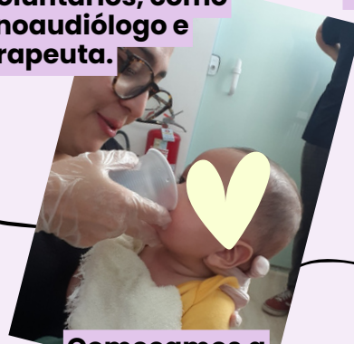
Começamos a prepará-lo para sua introdução alimentar aos 5 meses