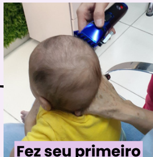
Fez seu primeiro corte de cabelo com 4 meses