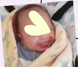
Aos 3 meses, começou a dar suas primeiras gargalhadas.