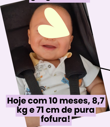
Hoje com 10 meses, 8,7 kg e 71 cm de pura fofura!