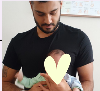
Devido à prematuridade, passou a receber atendimento de profissionais voluntários, como pediatra, fonoaudiólogo e fisioterapeuta.