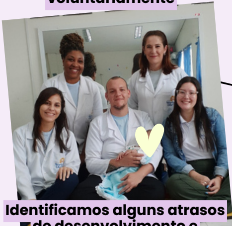
Identificamos alguns atrasos de desenvolvimento e inserimos ele no Programa de Estimulação Precoce