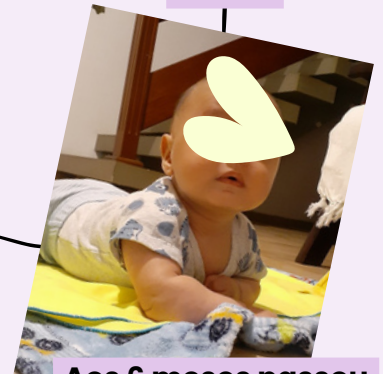
Aos 6 meses passou a sustentar a cabeça sozinho