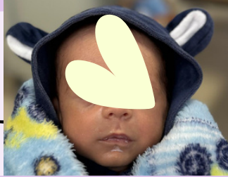
Nosso pequeno, que nasceu prematuro, passou 60 dias internado e conquistou o carinho de toda a equipe de enfermagem