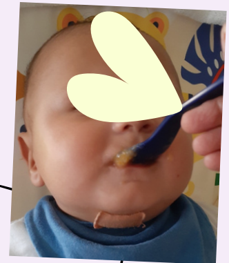
Logo começou a comer!